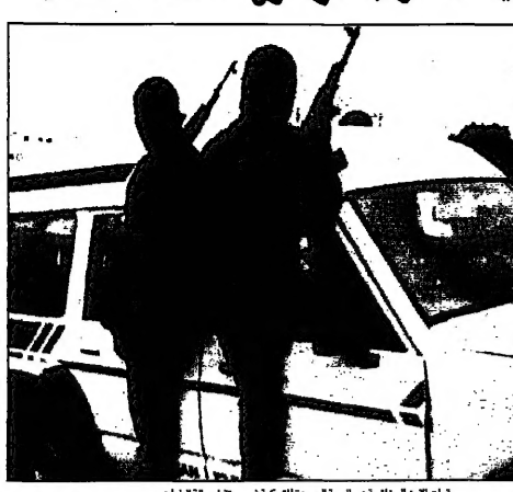
فريات الجزائريين في الجبهة الجديدة للسلام في سبيل حالة الطوارئ